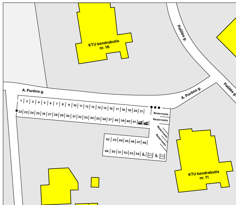
Automobilių statymo planas